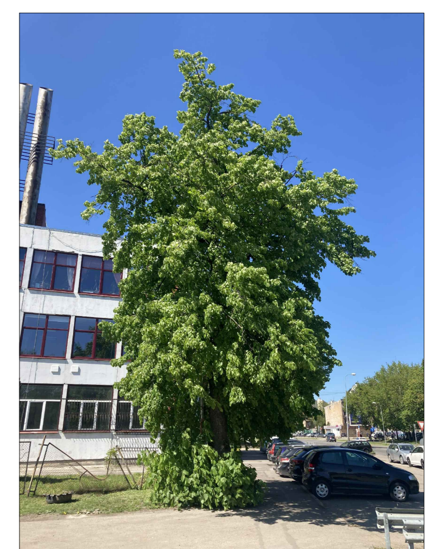
Cirst paredzētā 1 liepa \varnothing 47 cm